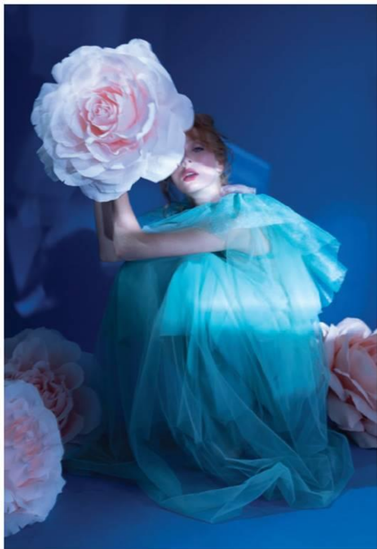
TRANG NÀY: Đầm FLAVIA MARDI Vòng cổ PORT'ARTE TRANG ĐỒ DIỆN: Đầm tulle ÊTRE Vòng tay kim loại và hoa tại NEITHAN HERBERT