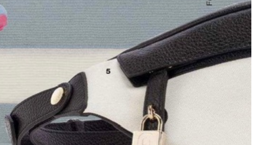
Foto di sfilata Gorunway