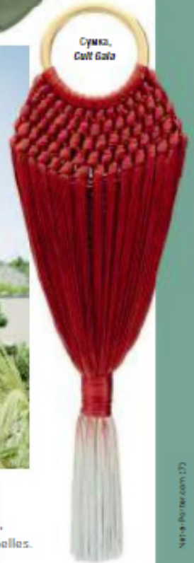
Сумка, Coff Gato

Ансе Лацио на острове Праслен – один из красивейших пляжей планеты, так что красота спасает мир прямо на глазах у постояльцев Raffles Seychelles.