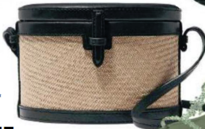
Сумка, Hamling Season