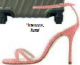
Босоножки, Manolo Blahnik