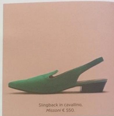
Slingback in cavallino, Missoni € 550.