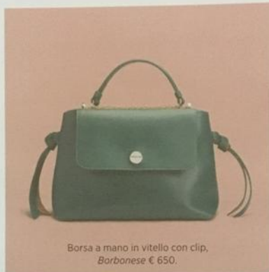
Borsa a mano in vitello con clip, Barbanese € 650.

DAL VERDE QUERCIA ALLE SFUMATURE DEL MUSCHIO, L'AUTUNNO E GREEN