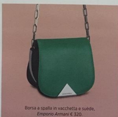
Borsa a spalla in vacchetta e suède, Emporio Armani € 320.