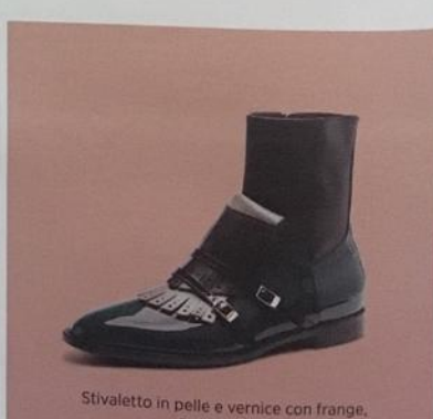
Stivaletto in pelle e vernice con frange, Pollini € 275.