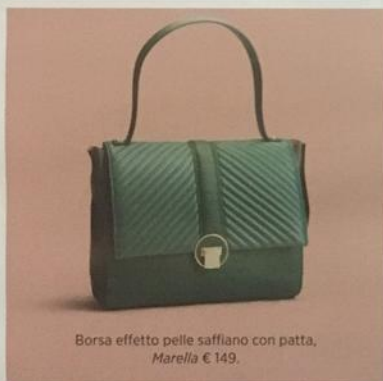
Borsa effetto pelle saffiano con patta, Marella € 149.