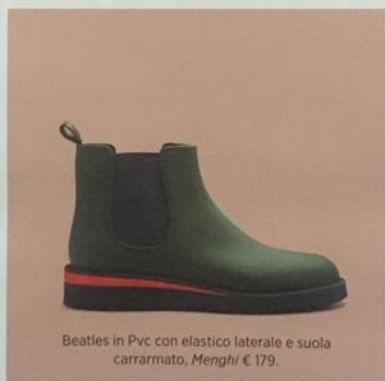
Beatles in Pvc con elastico laterale e suola carrarmato, Menghi € 179.