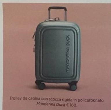
Trolley da cabina con scocca rigida in policarbonato, Mandarina Duck € 160.