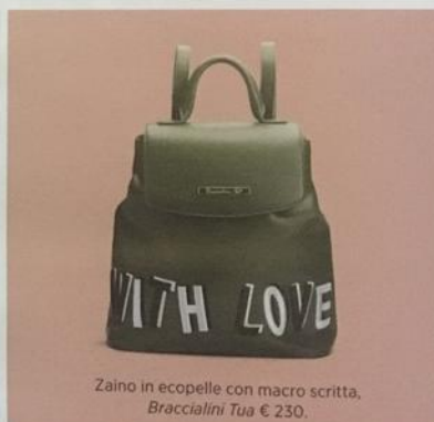
Zaino in ecopelle con macro scritta, Braccialini Tua € 230.